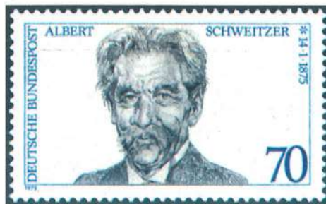
Sello alemán de 1975, dedicado al centenario del doctor Albert Schweitzer, y emisión paquistaní de 1973 dedicada al descubrimiento del bacilo de la lepra.