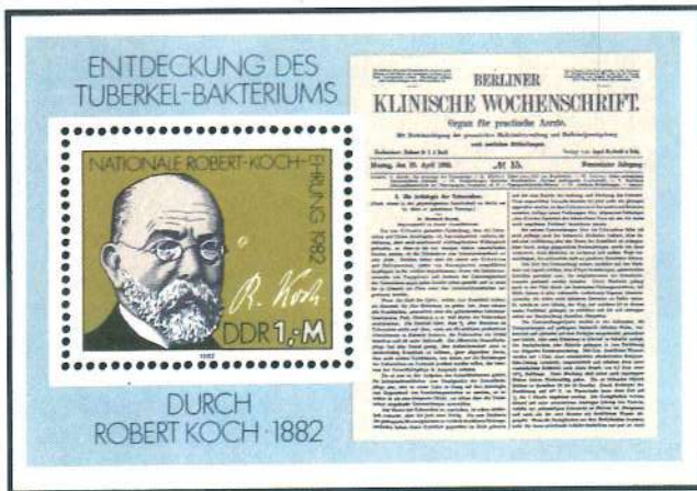
Hoja bloque emitida por la RDA en 1982 dedicada a Robert Koch, el descubridor del bacilo de la tuberculosis.

sustancialmente el número de emisiones, hasta el punto de que hoy en día pasan de 20.000 los sellos relacionados con la medicina, motivo más que suficiente para que su coleccionismo sea estructurado por apartados o temas que lo hagan más accesible. Dentro de la medicina general se pueden establecer dos grandes grupos, el humano y el técnico. En el primero se incluyen médicos, científicos, farmacéuticos y cuantas personas estén relacionadas con esta profesión. En el segundo, los medios materiales utilizados para curar: hospitales, medicamentos, descubrimientos, aparatos, vehículos y cuantos temas estén relacionados directa o indirectamente con la medicina.