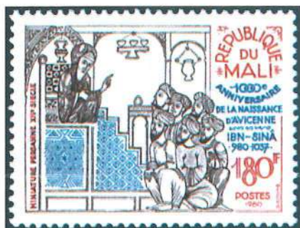
Sello perteneciente a la serie que Malí dedicó en 1980 al milenario de Avicena, el «príncipe de los médicos».

han sido representados en numerosos países. Así por ejemplo, Hipócrates (460-365 a.C.), el fundador de la medicina ha sido recordado por una docena de emisiones; a Avicena (980-1037), apodado el «príncipe de los médicos», le han dedicado sellos una veintena de países; las emisiones dedicadas a Alexander Fleming, quien en 1929 descubrió la penicilina, suman veinticuatro ejemplares; el descubridor del bacilo causante de la lepra, Gerhar Henrik Armaner Hansen (1841-1912), ha sido recordado por dieciséis países; el descubridor de la poliomielitis, el médico alemán Jakob von Heine, por quince; Buenaventura Orfila (1787-1853), fundador de la toxicología, ha sido recordado en dieciocho ocasiones... Para finalizar lo que sería una larga lista, citemos a los que más veces han sido representados en los sellos: Alberto Schwitze (1875-1965), médico y filántropo alsaciano cuya labor le ha valido el reconocimiento de más de medio centenar de países, y Robert Koch (1843-