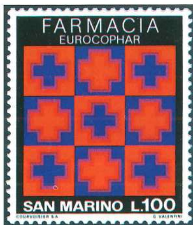
Sello de San Marino emitido en 1975 y dedicado al congreso internacional «Europhar». La farmacia es uno de los subtemas en que puede dividirse la temática «medicina».