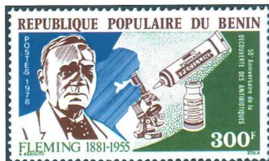
Sellos emitidos por Gabón y Benin en 1978 en el cincuenta aniversario del descubrimiento de los antibióticos por Alexander Fleming.