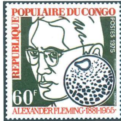
Dentro de la serie dedicada por la República del Congo en 1975 a los personajes célebres se incluyó la figura de Alexander Fleming, el descubridor de la penicilina.

La medicina, tanto en su vertiente humana como técnica, ha sido ampliamente contemplada en los sellos: las emisiones dedicadas a esta temática se iniciaron en los años veinte, y hoy en día constituyen una colección tan numerosa que es necesaria la especialización.