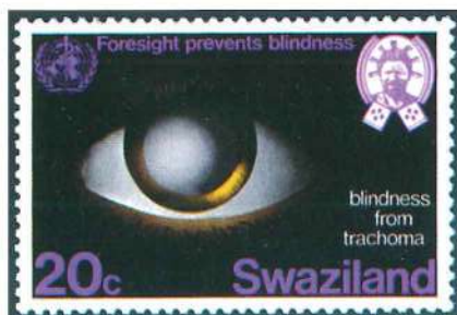
Sello de Swazilandia emitido en el Año Mundial de la Salud (1976).

han sido representados en numerosos países. Así por ejemplo, Hipócrates (460-365 a.C.), el fundador de la medicina ha sido recordado por una docena de emisiones; a Avicena (980-1037), apodado el «príncipe de los médicos», le han dedicado sellos una veintena de países; las emisiones dedicadas a Alexander Fleming, quien en 1929 descubrió la penicilina, suman veinticuatro ejemplares; el descubridor del bacilo causante de la lepra, Gerhar Henrik Armaner Hansen (1841-1912), ha sido recordado por dieciséis países; el descubridor de la poliomielitis, el médico alemán Jakob von Heine, por quince; Buenaventura Orfila (1787-1853), fundador de la toxicología, ha sido recordado en dieciocho ocasiones... Para finalizar lo que sería una larga lista, citemos a los que más veces han sido representados en los sellos: Alberto Schwitze (1875-1965), médico y filántropo alsaciano cuya labor le ha valido el reconocimiento de más de medio centenar de países, y Robert Koch (1843-